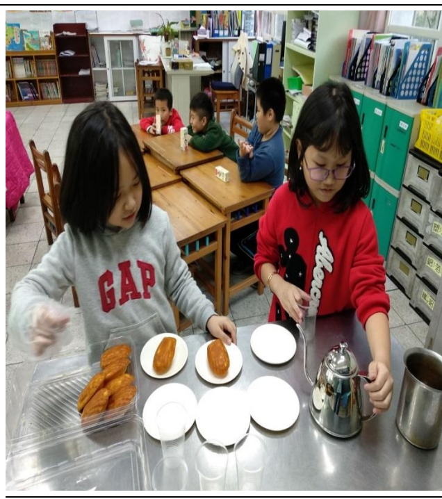
小主人準備點心飲料招待小客人