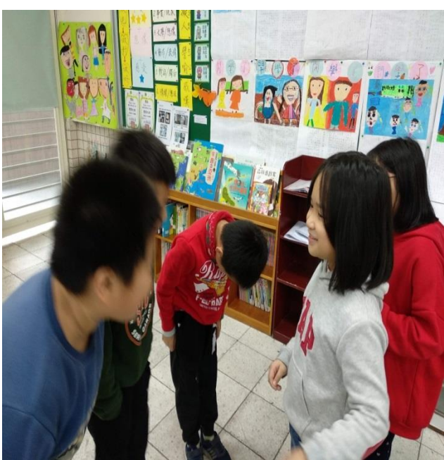
小主人與小客人學習單