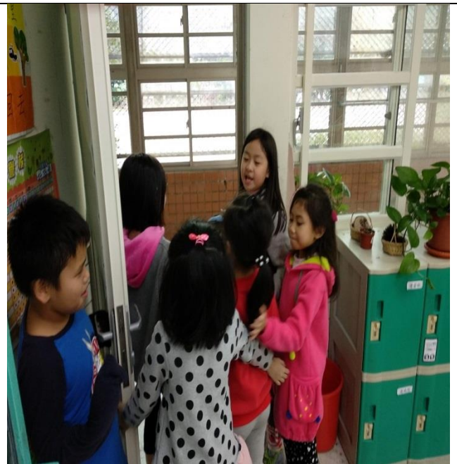
小主人小客人生活實踐，有禮貌互道再見。