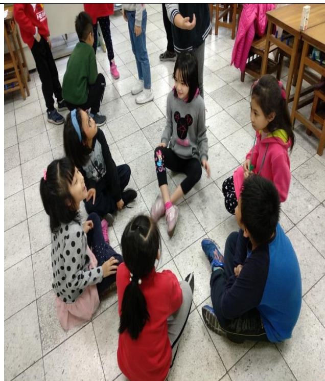
小主人小客人生活實踐，和樂的一起玩。