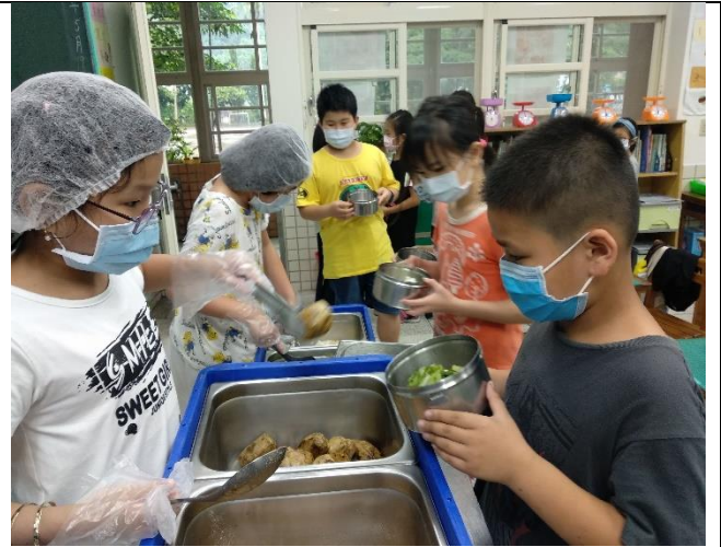
懂得感恩，拿取適合自己的飲食分量