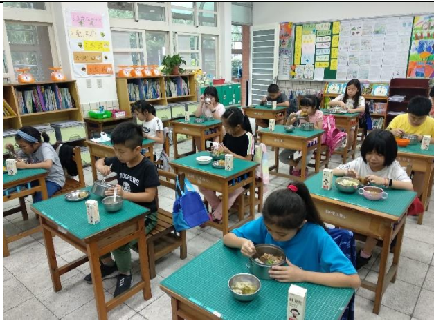
乾淨的用餐環境，好好享用餐點