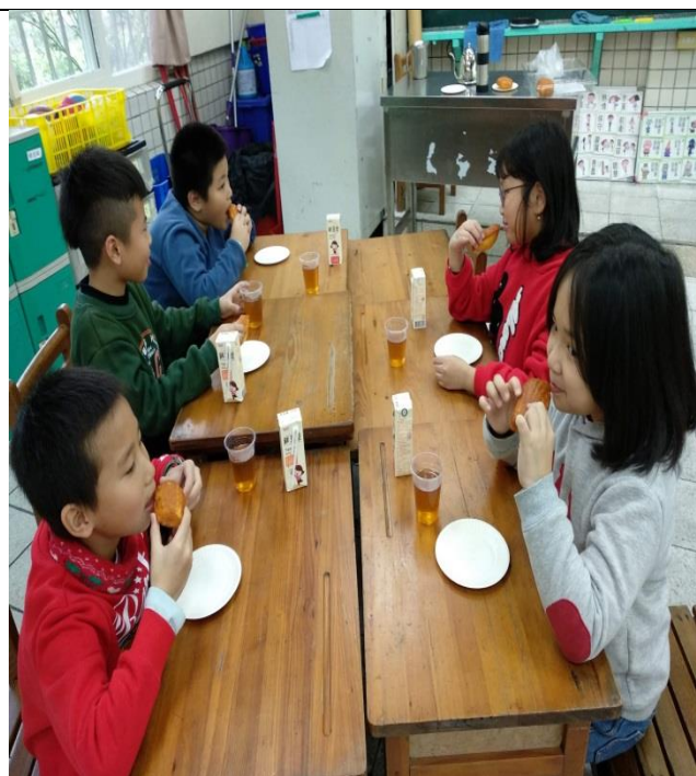
小主人小客人生活實踐，注意餐桌禮儀。